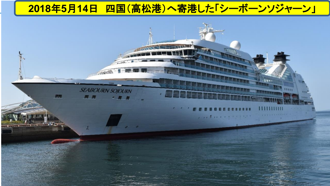
2018年5月14日 四国(高松港)へ寄港した「シーボーンソジャーン」

【シーボーンソジャーン諸元】 総トン数:32,346トン 全 長 :198.19m 全 幅 :25.2m 喫 水 :6.4m 乗客数:450人 乗組員数:330人